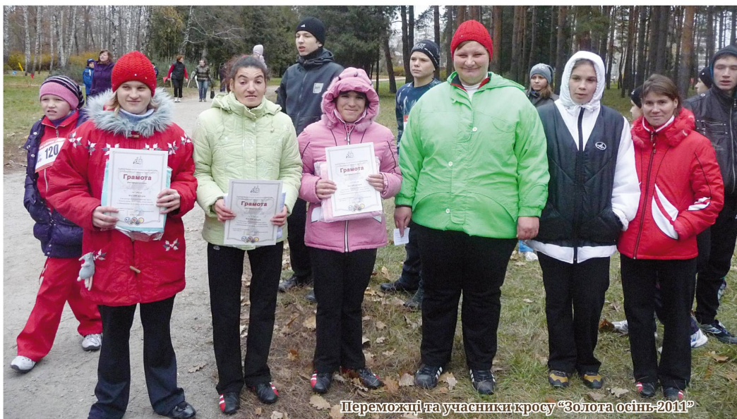
Переможці та учасники кросу «Золота осінь-2011»