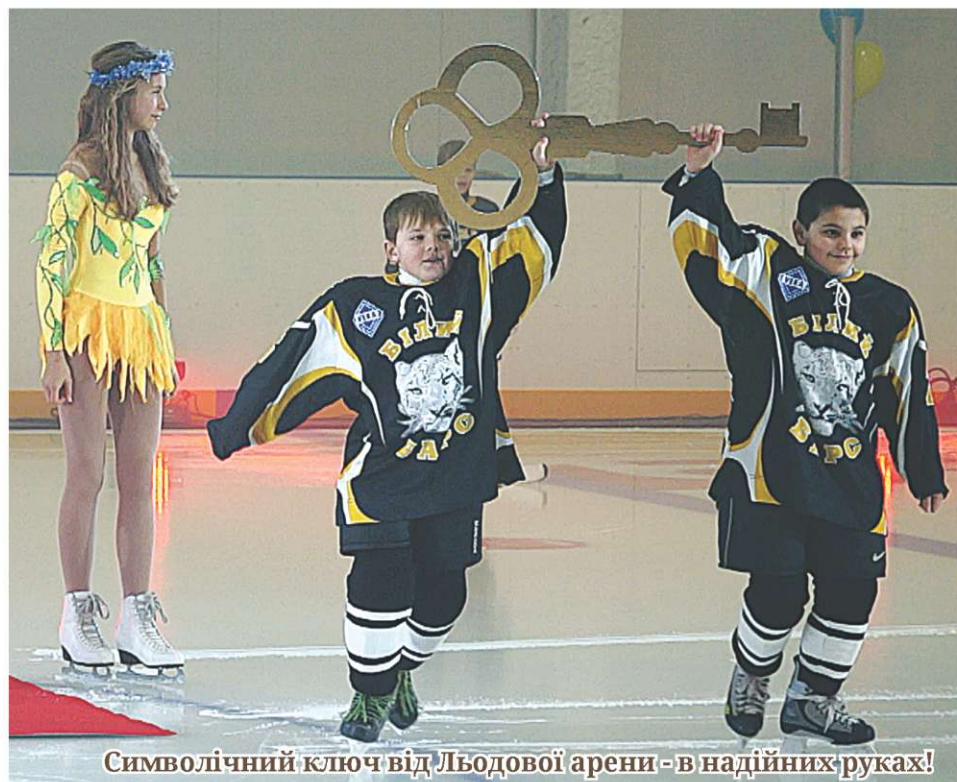
Символічний ключ від Льодової арени - в надійних руках!

За рекордно короткі терміни (з квітня до листопада 2012 року) на масиві Леваневського з'явилася новобудова. І це не кафе, ресторан чи готельний комплекс, як зазвичай, буває останнім часом, а сучасна велична спортивна споруда – Льодова арена. Відкриття новенької споруди зі штучним льодовим покриттям, збудованої в Білій Церкві на виконання ініціатив Президента України Віктора Януковича та Державної цільової соціальної програми «Хокей України», відбулося 7 грудня й ознаменувалося візитом багатьох поважних гостей та зірок фігурного катання світового рівня.