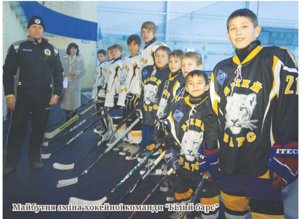
Майбутня зміна хокейної команди «Білий барс»

- Я запрошую всі родини проводити своє дозвілля на Льодовій арені! Вдячний всім, хто допомагав у її спорудженні. Особисто хотів би подякувати будівельникам ТОВ «Білоцерківміськбуд», спеціалістам, які виконували монтажні роботи, оздоблення території навколо арени, робітникам, які обладнали дві великі парковки – загальною площею 2 100 кв.м. І це все для того, аби ваше спілкування зі спортом було максимально яскравим і водночас простим, а головне – дарувало якомога яскравіші враження від занять зимовими видами спорту та