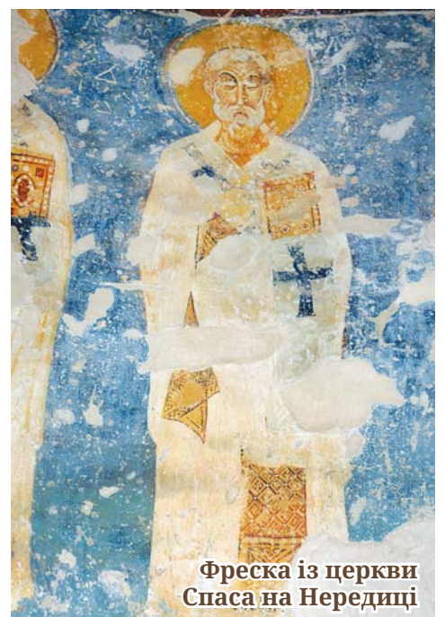
Фреска із церкви Спаса на Нередиці