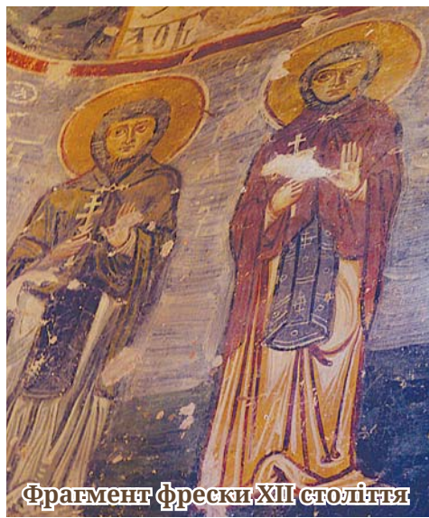
Фрагмент фрески XII століття

Після Кремля прямуємо до церкви Спаса на Нередиці. Їх, церков, стільки, що очі розбігаються. В Україні, якщо збереглася десь церква хоча б XIX століття, то їй уже приділяють велику увагу - бо раритет. У Новгороді (та й по всій Росії) храмів дуже багато, правда, не всі вони відновлені та доглянуті. Мальовничих руїн вистачає. Церква Спаса на Нередиці унікальна своїми внутрішніми розписами. Німецький снаряд улучив прямо в споруду, але більш ніж 15% робіт стародавніх живописців вдалося врятувати. Колись яскраві фарби стали тьмяні, фрескам не вистачає глибини простору, але вони чудові. Поряд з обрами святих можна побачити портрети новгородських князів, а середньовічні бешкетники залишили на стінах свої «автографи».