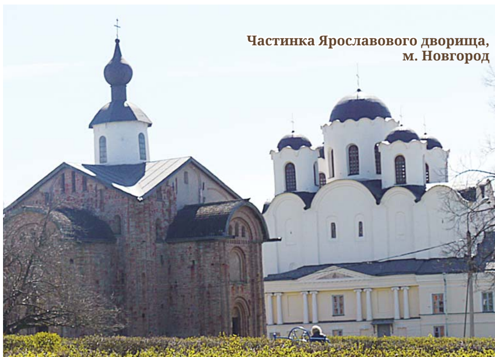
Частинка Ярославового дворища, м. Новгород