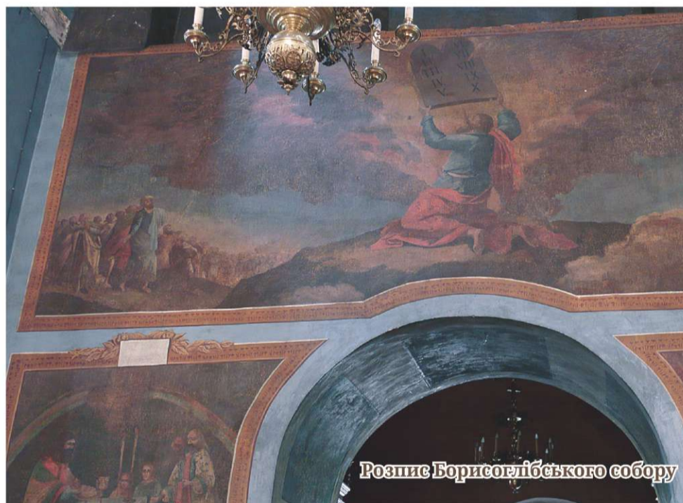
Розпис Борисоглібського собору

Отож аби дослідити зовнішній вигляд церков такого типу вирушила на північ міні-експедиція, яку спорядив Благодійний фонд Костянтина Єфименка. За чотири дні ми мали подолати понад три з половиною тисячі кілометрів, три державні кордони, зустрітися з науковцями